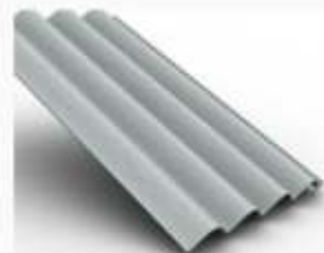
Teja Ondulada P10