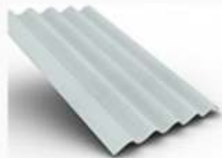
Teja Ondulada P7

Ofrecemos una amplia gama de cubiertas en fibrocemento para todas sus construcciones, tejas de alta resistencia, durabilidad y elegancia.