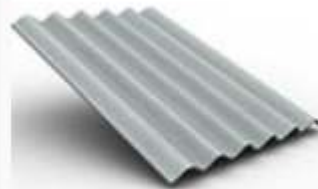
Teja Ondulada P7 Plus